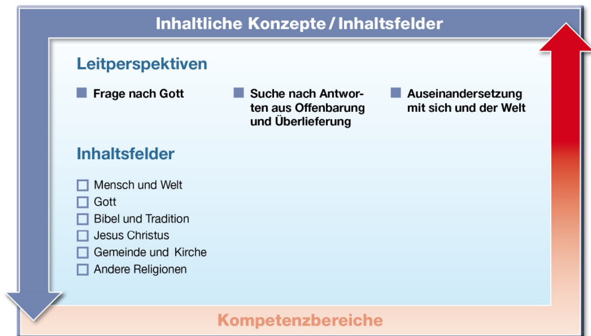
Abb. 2: Leitperspektiven und Inhaltsfelder

Die Inhaltsfelder richten sich an den Leitperspektiven des Faches aus und erschließen sie inhaltlich. Diese Leitperspektiven „Frage nach Gott“, „Suche nach Antworten aus Offenbarung und Überlieferung“ und „Auseinandersetzung mit sich und der Welt“ stellen inhaltliche Konzepte dar, die sich auf die Systematik des Faches beziehen und das gesamte Spektrum der Wissens Elemente durchdringen. Die drei Leitperspektiven entfalten wechselseitig sechs Inhaltsfelder, die die unverzichtbaren Wissensbestände des Faches darstellen. Die fachlichen Beziehungen werden durch den Konzeptgedanken über die Primarstufe hinaus bis in die Sekundarstufe I als roter Faden deutlich.